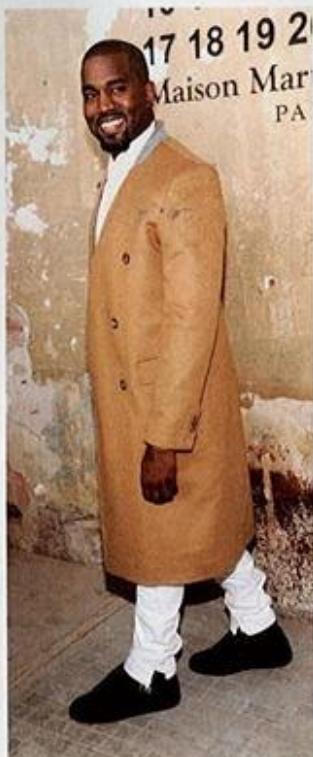
Raper Kanye West patrí k oddaným fanúšikom tvorby Martina Margiela, ktorý patrí k odchovcanom antrerpkej školy dizajnu.